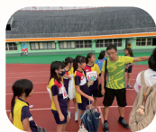
114 學年度市長盃 田徑國小錦標賽