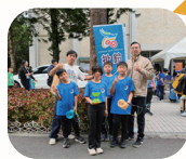
運動部全民運動署 114 年全國民俗 運動會演活動扯鈴