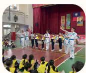
臺灣戲曲學院表演