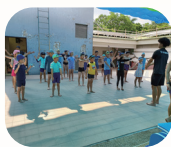
114 學年度 暑假游泳活動