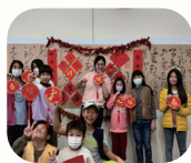
114 學年度社區 生活營書法活動