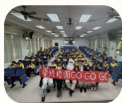
淨零綠校園故事 媽媽劇團