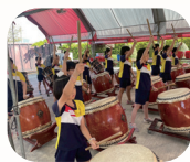
114 學年度 文橫書院太鼓表演