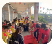
公親里自主防災 入校宣導