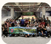
環境教育研習 SNOWIN 滑雪學校