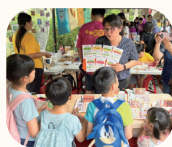
尖山埤永續生活節