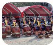
114 學年度市長盃 傳統藝術比賽