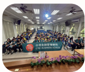
中信管理學院法服 社網路使用宣導