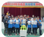
114 學年度市長盃 扯鈴比賽